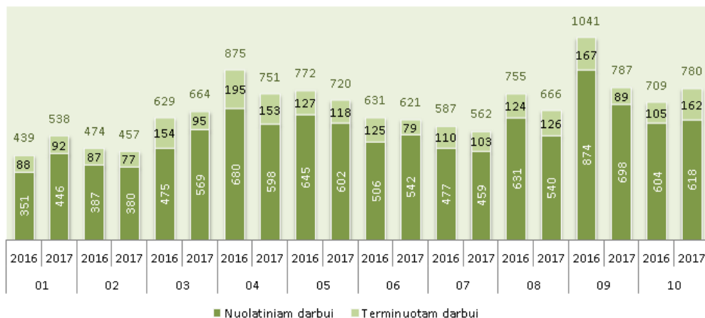
Įdarbinimas 2016–2017 metais pagal mėnesius

Įdarbintų asmenų skaičius 0,9 proc. mažesnis negu praeitą mėnesį ir 10,0 proc. didesnis negu praeitų metų spalio mėnesį.