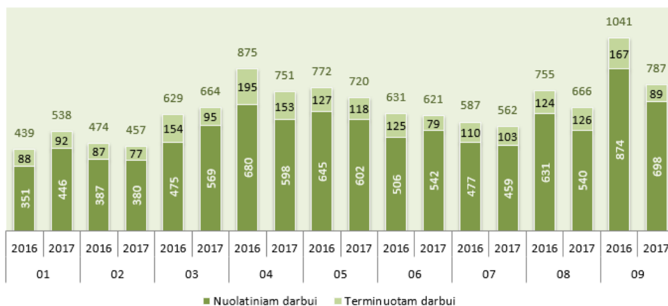
Įdarbinimas 2016–2017 metais pagal mėnesius

Įdarbintų asmenų skaičius 1825 proc. didesnis negu praeitą mėnesį ir 24,4 proc. mažesnis negu praeitų metų rugsėjo mėnesį.