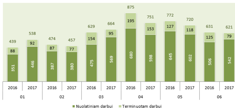
Įdarbinimas 2016–2017 metais pagal mėnesius

Įdarbintų asmenų skaičius 13,8 proc. mažesnis negu praeitą mėnesį ir 1,6 proc. mažesnis negu praeitų metų birželio mėnesį.