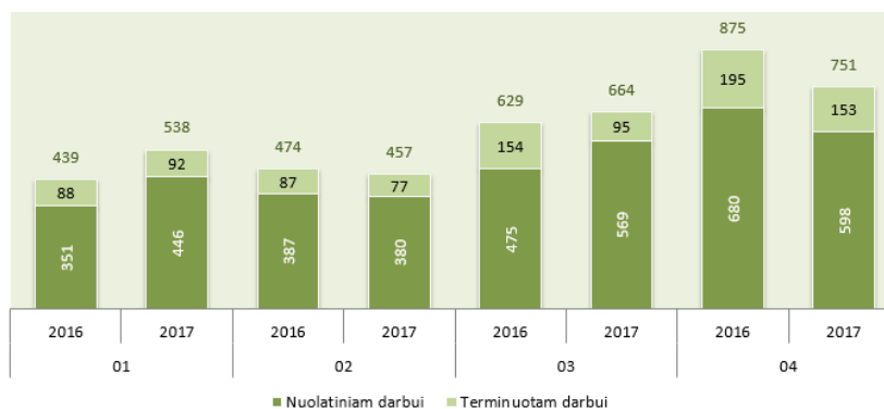
Įdarbinimas 2016–2017 metais pagal mėnesius

Įdarbintų asmenų skaičius 13,1 proc. didesnis negu praeitą mėnesį, bet 14,2 proc. mažesnis negu praeitų metų balandžio mėnesį.