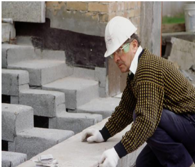
[atkelta iš 2 psl.]

teikiamomis lengvatomis, vykdant savarankišką veiklą pagal verslo liudijimus, per šį laikotarpį pasinaudojo 36,2 tūkst. asmenų.