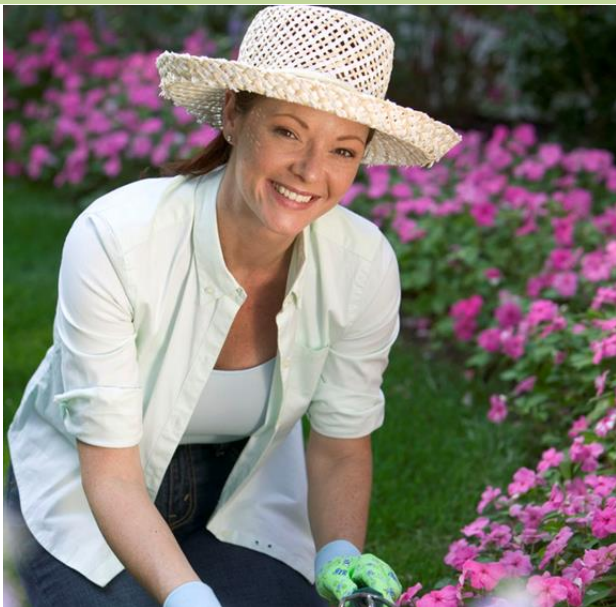
[atkelta iš 1 psl.]

rodiklį. Bedarbės moterys birželio 1 d. sudarė 8,0 proc. šalies darbingo amžiaus moterų. Teritorinėse darbo biržose buvo registruota 69,2 tūkst. neturinčių darbo moterų.